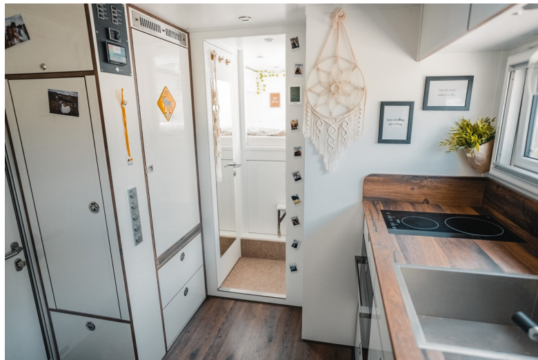
EXCAP Steyr 12M18 mit KRUG XP Wohnkabine · Exposé